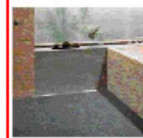
キッチン・ダイニング・浴室に