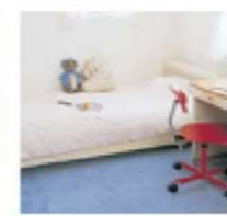
リビング・ダイニングなどに