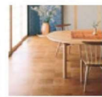
キッチン・ダイニング・浴室に